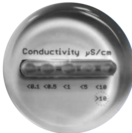
Konduktivitetsmätare Secon V3-10